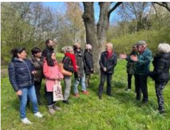
Bezoek aan het Heempark te 's-Hertogenbosch-Zuid

Heel graag werken we samen met bedrijven om onze deelnemers meer de sfeer van Het Bossche te geven en zich hier ook echt 'thuis' te gaan voelen maar ook meer van de historie van de stad te leren en te weten. De deelnemers aan de taalles waarderen het altijd heel erg als ze ergens voor uitgenodigd worden en ook de bedrijven zien de meerwaarde er van in voor onze deelnemers, voor hun bedrijf en hun medewerkers. Gelukkig hebben we dit jaar weer een match kunnen uitvoeren en kregen de deelnemers een rondleiding in het Heempark. Het werd een prachtige ochtend/ middag met veel nieuwe taal in een prachtige leeromgeving. In 2022 hebben we weer mooie matches af kunnen sluiten en hopen dat we die in 2023 allemaal kunnen uitvoeren. Zo staat er gepland: een bezoek aan Weener XL, een wandeling in de tuinen van Mariaoord met daarin o.a. de Vlindertuin, een museumbezoek op uitnodiging van Van Lanschot. Een jeu de boules wedstrijdmiddagje bij de van Neynselstichting, een bezoek aan het Vicki Brownhuis en als het lukt sluiten we aan bij een voorstelling bij Perron 3 een mooi lijstje extra activiteiten voor de deelnemers aan de taalles.